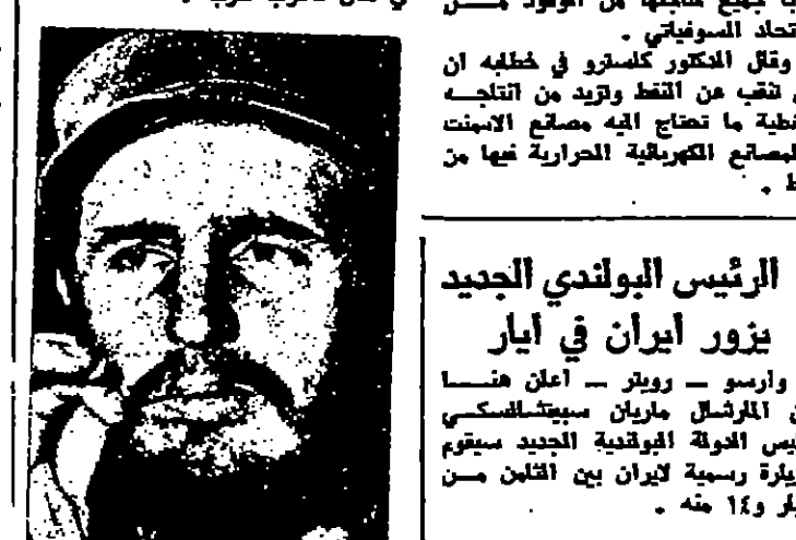
الرئيس البولندي الجديد

واشنطن - رويتر - وافق اميركا على ان تستلم اربعة اطنان من الاسلحة المتخفية في كندا من قبل اميركا.